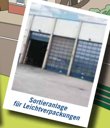
Sortieranlage für Leichtverpackungen